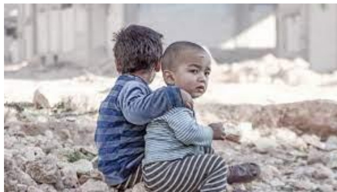
Protecting each other from air strikes

Thought is greater than armies, Thoughts are more powerful than fighting men. Their beginnings are feeble but their effect is mighty.