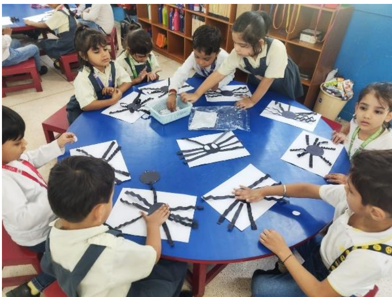
The Nursery/Kindergarten years