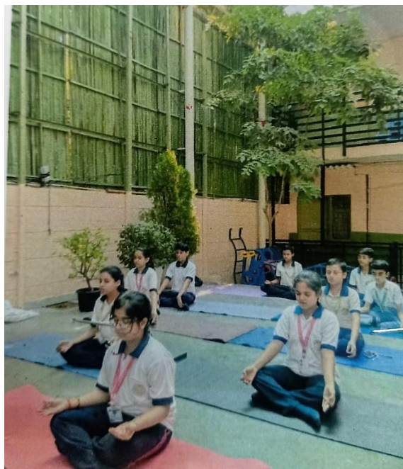
Yoga brings peace