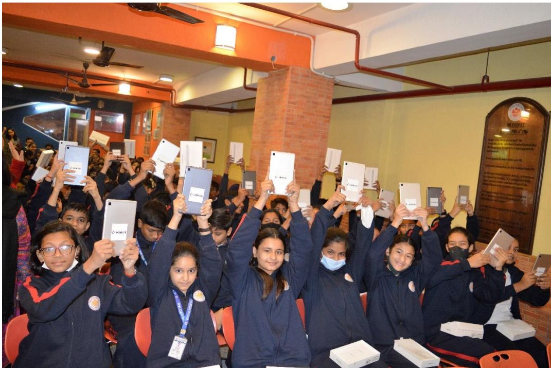
Students delighted with digital tablets